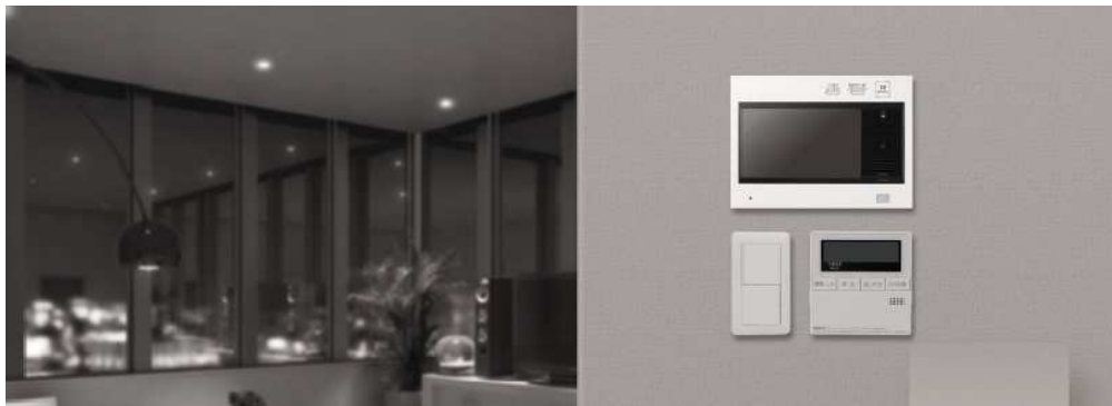
従来機種との比較