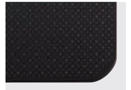
グレースブラック