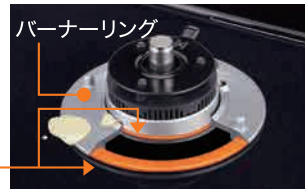
イラストはイメージです