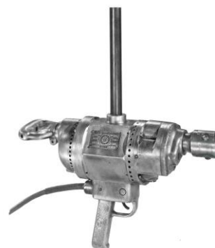
世界初「ピストルグリップ式」 電動ドリル（1916年）

社 名 ブラック・アンド・デッカー (Stanley Black&Decker Inc.) 本 社 アメリカ合衆国コネチカット州ニューブリテン 1000 Stanley Drive NewBritain, CT96953 USA 設 立 1910年（ブラック・アンド・デッカー） 代 表 者 ジェイムス・M・ローリー（CEO） 上 場 ニューヨーク証券取引所 (NYSE:SWK) 売 上 112億ドル（2015年） 日 本 法 人 ポップリベット・ファスナー株式会社 （株主：Stanley Black&Decker Inc. 100%） ブラック・アンド・デッカー事業部 〒171-0022 東京都豊島区南池袋 1-11-22 山種池袋ビル 4階