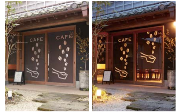
昼、外から見たとき

ロールスクリーンの生地をお好みのデザインや文字で切り抜くことができます。切り抜いた部分はボイル生地で、昼は外からでも室内の様子が感じられ、夜は室内の明かりでデザインのシルエットが際立ちます。店舗の窓などでの広告媒体としてもおすすめです。