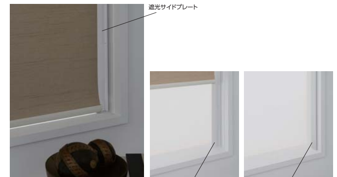
遮光サイドプレートを開いたとき

遮光サイドプレートの製作サイズを2500mmまで拡大し、テラス窓など高さのある窓にも対応。窓枠と生地間に設置することで、生地両サイドからの直射光を遮り、まぶしさを抑え遮光性を高めます。遮光サイドプレートは、生地を巻き上げているときは折りたたむことができるので、見た目がすっきりし、出入りや掃除がしやすくなります。